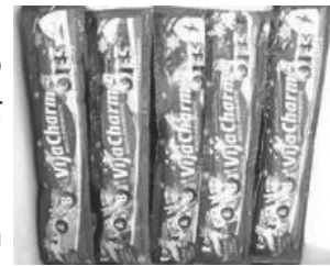
Vitacharm Es, enak dan sehat, lho!

www.kidnesia.com/kidnesia/Barang-Baru/Hiburan/Jajan-Es-Boleh-kok (2010)